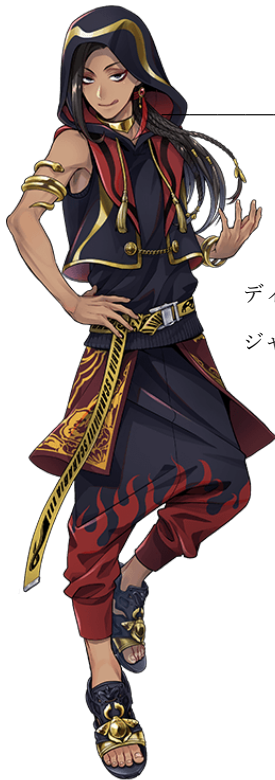
ジャミル・バイパー